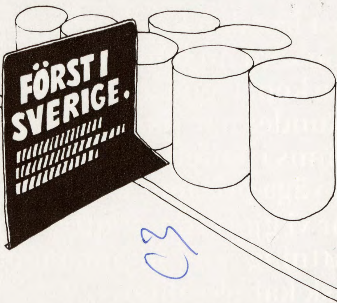
Små lättplacerade hylltalare