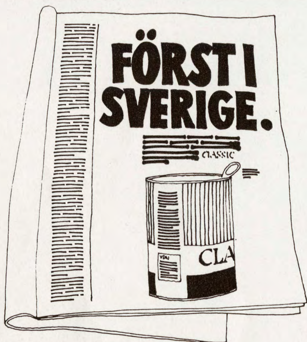
Stora annonser i dagspress och veckopress