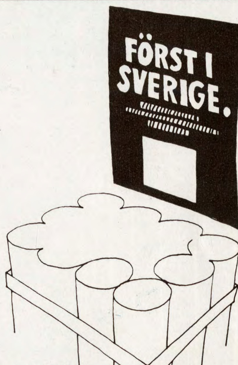
35 x 50-skyltar för massexponeringar